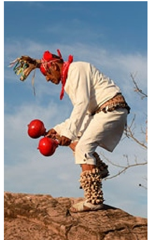
Danza del Venado. Riqueza cultural

Como transcurrieron ya más de cinco años de no cumplir con ese ordenamiento, hoy los pueblos indígenas del estado de Sinaloa buscan a través del amparo, la protección de la justicia federal para hacerlo realidad.