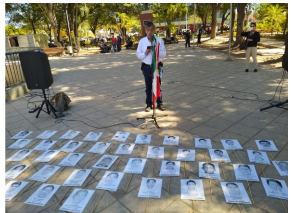
Sinaloa. Mitin de apoyo.

Ojalá al retomar el compromiso de esclarecer el Caso de los 43 desaparecidos, tengamos la suerte de alcanzar la Justicia Plena.