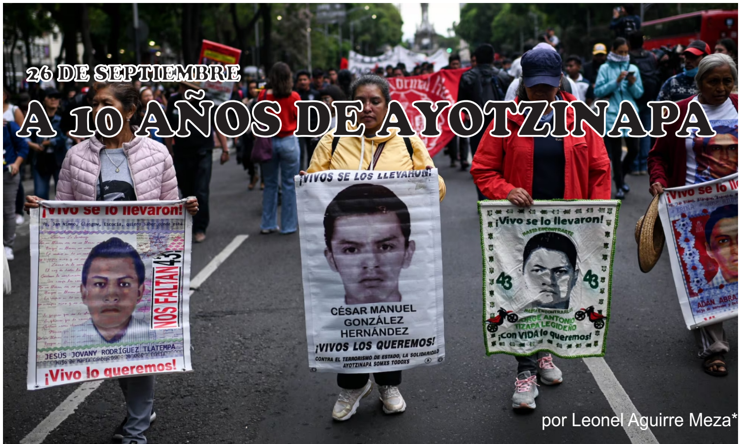
por Leonel Aguirre Meza*

Lo sucedido en Ayotzinapa el día 26 de septiembre de 2014 fue un hecho de dolor y vergonzoso que cimbró a nuestro país.